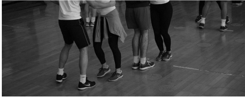
Slika 4. Pravilno izvođenje plesnog koraka